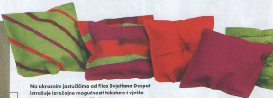
Na ukrasnim jastučićima od filca Svetlana Despot istražuje izražajne mogućnosti teksture i vješto kombinira razne uzorke i boje